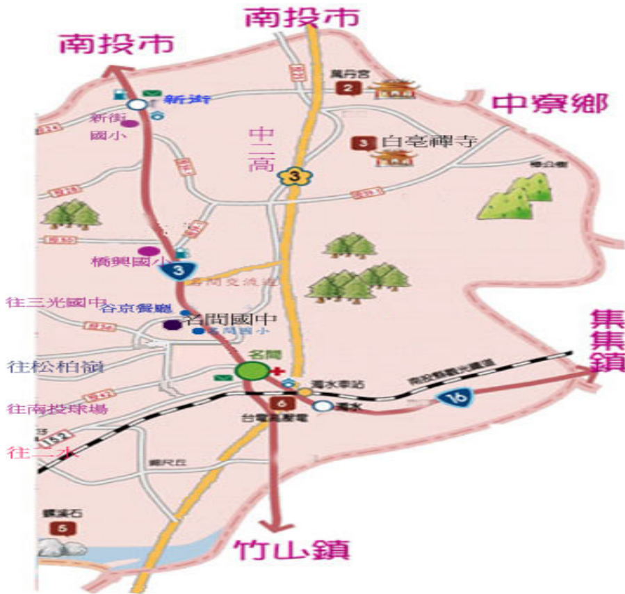
[ 臺南市大橋國中 交通方式 ]