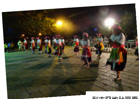
利吉惡地社區原住民熱舞迎賓。

此外，值此 0708 尼伯特颱風災害後各界關懷臺東之際，本活動不僅可深化全民對於國土永續管理之認同感，亦可喚起「擁抱臺東」的意識，展現對於大地的熱情，並對臺東地區觀光，促進地方經濟發展有所助益。