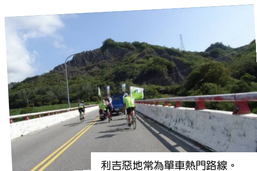
利吉惡地常為單車熱門路線。

相關訊息請見：地質知識網絡粉絲團（ https://www.facebook.com/twgeoref ）。